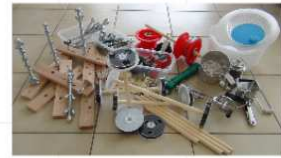
"draaien en tollen"