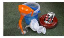
"water en flexibels"